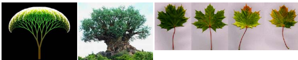
Fig. 3. Estructura arbórea con simetría perfecta (izquierda). Árbol real disimétrico (centro). Variación de color en las hojas de un árbol, que agrega disimetría cromática a la disimetría formal (derecha).

tener también reflexiones especulares combinadas con traslaciones— son solamente aproximadas; no hay dos ramas exactamente iguales ni dos hojas idénticas. Lo mismo sucede con la coloración de cada una de las partes: el patrón cromático tiene ligeras variaciones dentro de ciertos rangos (Fig. 3).